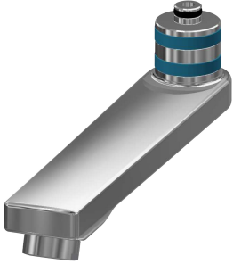
Schwenkauslauf, 160 mm

Wascharmaturen | Selbstschluss-Armaturen