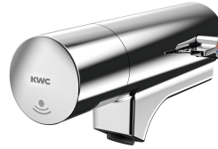
F5E-Mix Elektronik-Waschplatzbatterie für Armatureneinheit oder Wandflansch