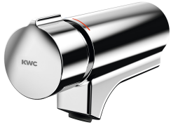
F5S-Mix Selbstschluss-Eingriffmischer für Armatureneinheit oder Wandflansch