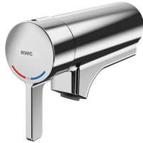
F5L-Therm Einhebel-Thermostat für Armatureneinheit oder Wandflansch