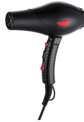
Ref. 01032 Finish: Black Finition: Noir Power: 2.100 W Puissance: 2.100 W