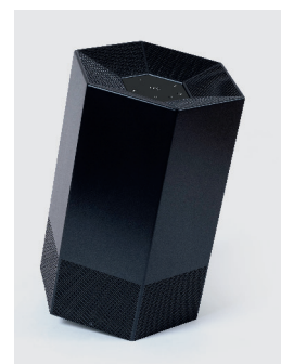
MATTSCHWARZ REF. 8 77 2127-BK

ELIMINIERT 100% ALLER BEEINTRÄCHTIGUNGEN