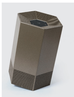
BRONZE REF. 8 77 2127-BR