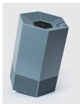
SAPHIRBLAU REF. 8 77 2127-BL