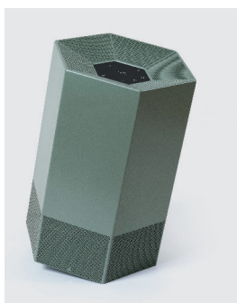
MALACHITGRÜN REF. 8 77 2127-GR