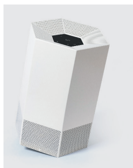
CREMEWEISS REF. 8 77 2127-WH

Professioneller Luftreiniger aus Frankreich entspricht der Norm NF B44-200 auf einer Fläche von 60 m 2 .