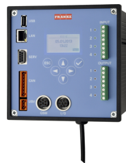
ECC2 FUNKTIONSCONTROLLER: ZA3OP011